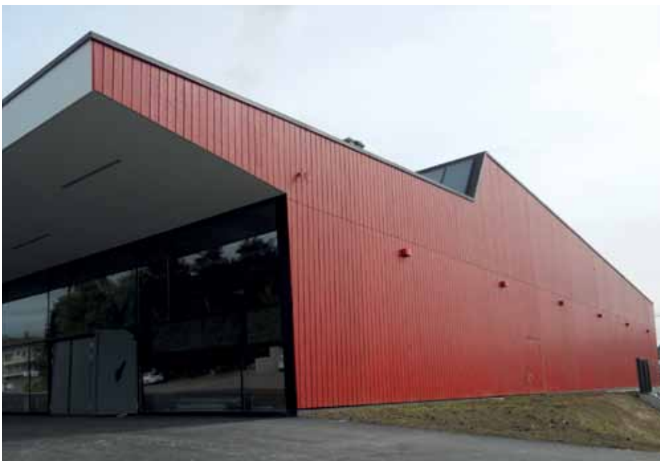
Salle de sport triple Estavayer-le-Lac