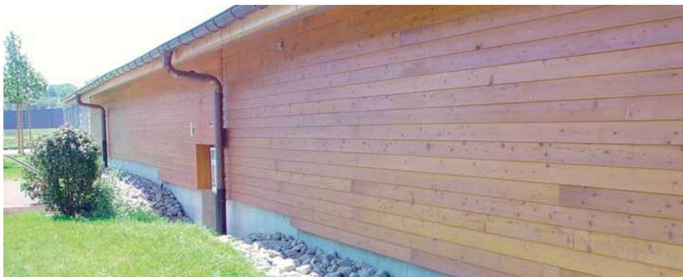
Lame sapin du nord, profil 7000 Aussenschalung Nordische Fichte, Profil 7000