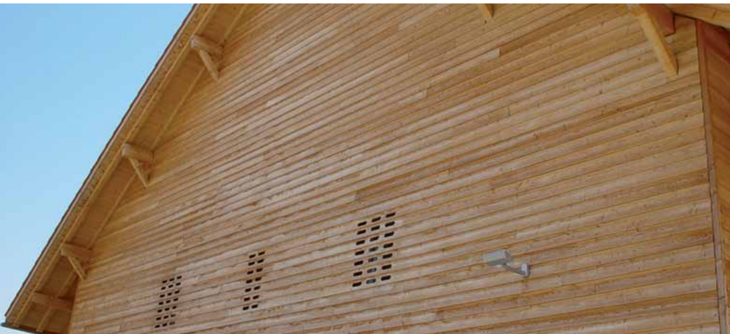
Lame mélèze, profil 7000 Aussenschalung Lärche, Profil 7000